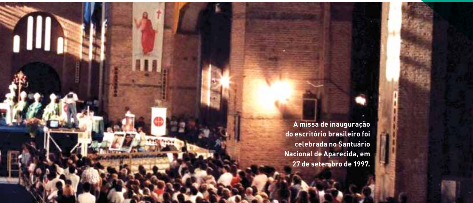
A missa de inauguração do escritório brasileiro foi celebrada no Santuário Nacional de Aparecida, em 27 de setembro de 1997.

lado de uma equipe de 15 colaboradores e das Irmãs Carmelitas Mensageiras do Espírito Santo.