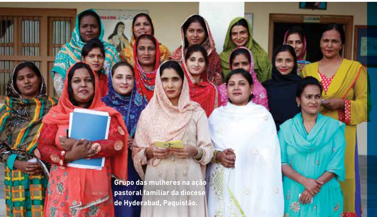
Grupo das mulheres na ação pastoral familiar da diocese de Hyderabad, Paquistão.

Essa formação aos novos casais é também a preocupação da arquidiocese de Bangui, na República Centro-Africana. Aqui se acrescentam ainda alguns problemas: Aids; gravidez precoce; muitos órfãos e famílias monoparentais, como consequência da guerra civil de três anos. A formação dos 78 casais que futuramente deverão acompanhar e apoiar diversas famílias tem como referência os documentos dos Papas: Humanae vitae , de Paulo VI, Familiaris consortio , de São João Paulo II e Amoris laetitia do Papa Francisco. Os 78 casais serão como uma força-tarefa pela paz. Porque, como escreveu João Paulo II, “da família nasce a paz para a família humana”. ■