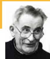
Pe. Werenfried van Straaten

Ajuda à Igreja que Sofre - Caixa Postal 46059 - Cep: 04045-970 - São Paulo - SP por e-mail: atendimento@acn.org.br ou pelo Facebook