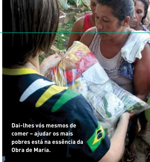
Dai-lhes vós mesmos de comer – ajudar os mais pobres está na essência da Obra de Maria.

A Comunidade Obra de Maria ajuda pessoas a buscarem Deus há 27 anos. Com o carisma de “servir a Deus com alegria” os missionários desenvolvem diversas atividades como assistência escolar e médica, evangelização de crianças, visita aos enfermos, construção de moradias para desabrigados etc. A principal frente apóstólica da Comunidade são os Cenáculos, pequenos grupos de oração familiares em que a oração do Terço e a partilha da Palavra alimentam a fé das famílias estimulando a vida orante e a comunhão com a Igreja.