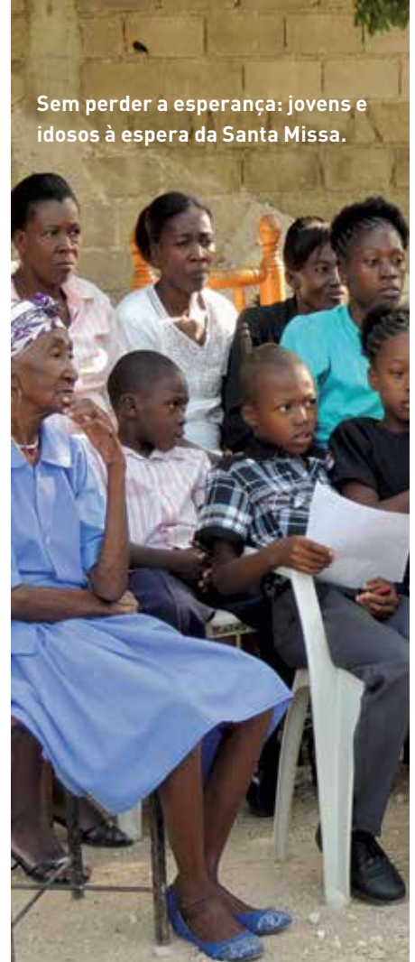
Sem perder a esperança: jovens e idosos à espera da Santa Missa.