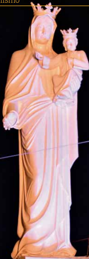
Homs, Síria Festa da Exaltação da Santa Cruz, 2016.