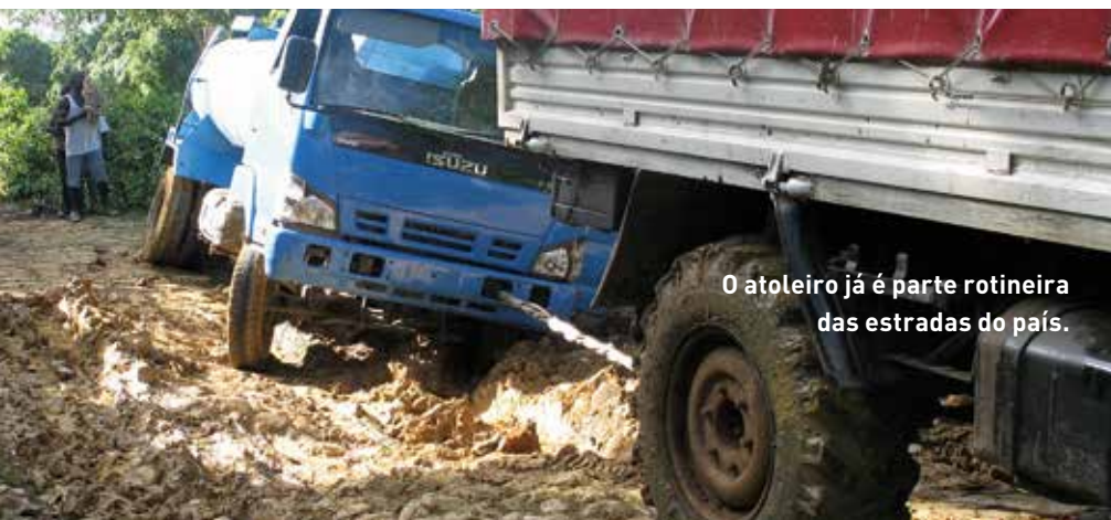
O atoleiro já é parte rotineira das estradas do país.