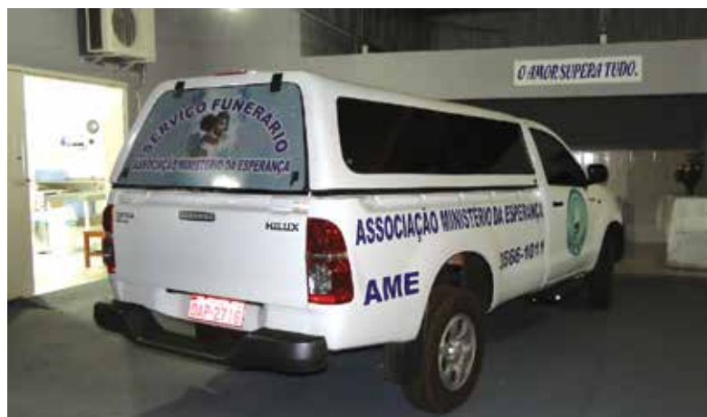
Além da reforma da sede, a ACN ajudou na compra de uma caminhonete para o transporte das urnas.

os familiares, refeitório e lanche. Até os ornamentos fúnebres básicos são usados sem custo algum. A ideia de Dom Franco deu tão certo que já se expandiu para outras cidades como Aripuanã e Colniza.