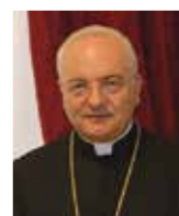
Cardeal Mauro Piacenza Presidente da ACN Internacional

Caros amigos, permitamos que o sopro do Espírito Santo possa nos envolver, e deixemo-nos renovar por “dentro” para operar, depois, para “fora”, a serviço da Igreja que sofre em tantos dos nossos irmãos e das nossas irmãs. Que Maria, a Esposa do Espírito Santo, obtenha ela mesma para nós o dom mais elevado dos Céus, o Espírito Santo.